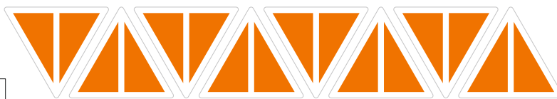
Położenie wskaźnika W17